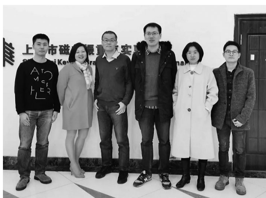
俪娃荷自成立以来致力于通过深度学习技术及自主研发的核心算法用于分析各类医学影像数

2019年,俪娃荷智能医疗在华东师大科技园应运而生,同时它还申请获得了人社部门的创业团队孵化场地费补贴。