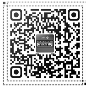
《上海市高校毕业生就业宝典》二维码

查询招聘信息，请登录高校毕业生就业服务平台( http://job.mohrss.gov.cn/202008gx/index.jhtml )、上海公共招聘新平台( jobs.rsj.sh.gov.cn )、“上海人社”APP、“乐业上