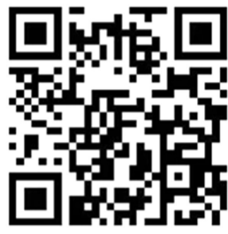
“未就业高校毕业生求职登记小程序”二维码